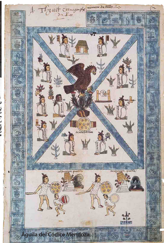
Agua del Códice Mendoza

Con todo este bagaje de obra trascendental, el rediseño del Escudo Nacional se le encargó a Eppens Helguera, el cual fue todo un éxito.