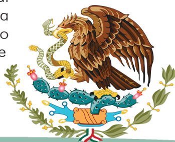
Actual desde 1968